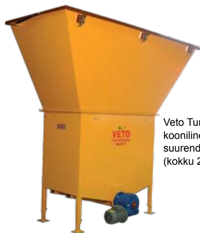
Veto Turvehakemaatti ja kooniline punkri suurendus (kokku 2,75 m 3 )