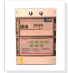
A-T Log 1 on loogika baasil töötav juhtkeskus

Ettevõtte Veljekset Ala-Talkkari OY on 50 aastane kodumaistele kütustele mõeldud soojusseadmete tootmise kogemus. Ettevõtte on osalenud kodumaiste kütuste kasutamise riiklikes arendustöodes, alates viimaste algusaegadest. Veto Turvehakemaatti on ühe arendustöö tulemus, mis oli suunatud lihtsalt käsitlevate seadmete tootmisele. Põleti on kinnitatud katla küljele ja toimib nagu õlipõleti vastavalt katla temperatuurile. Kütusena saab kasutada hakkepuitu, tükkturnast, graanuleid, briketti, vilja või sorteerjääke. Seadmeid on testitud vastavalt standardile EN-303-5 (VTT, Vakola, BLT Wieselburg, SP, Teknologisk Institut). Põleti komplekti kuulub loogika baasil töötav juhtkeskus, katla termostaat, vesi-kustutussüsteem, leegivalve, söötekanali ülekuumenemise kaitse ja pealüliti.